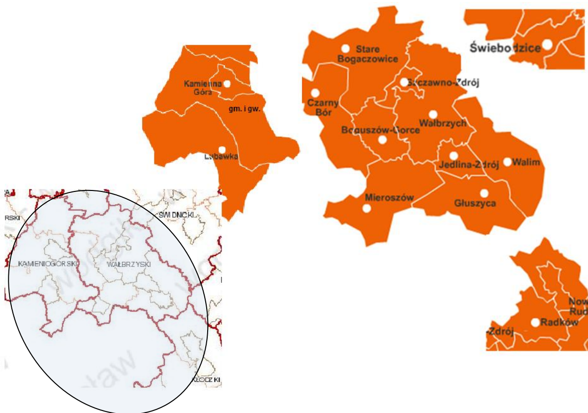
Rys. 1. Położenie gmin Aglomeracji Wałbrzyskiej