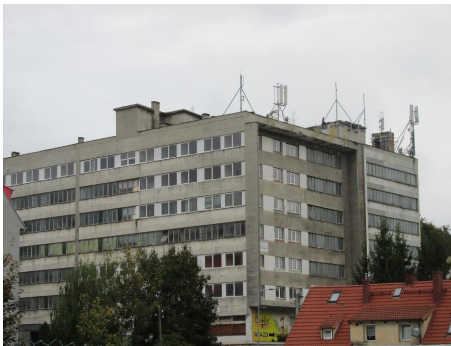
Zał. nr 1: Widok ogólny instalacji radiokomunikacyjnej.

Koniec sprawozdania. Sprawozdanie zawiera dodatkowo załączniki nr 1 i 2.