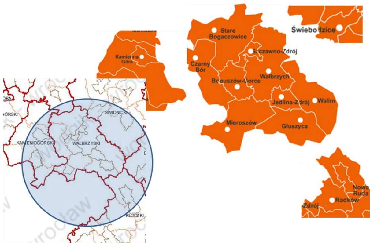
Rys. 1. Położenie gmin Aglomeracji Wałbrzyskiej