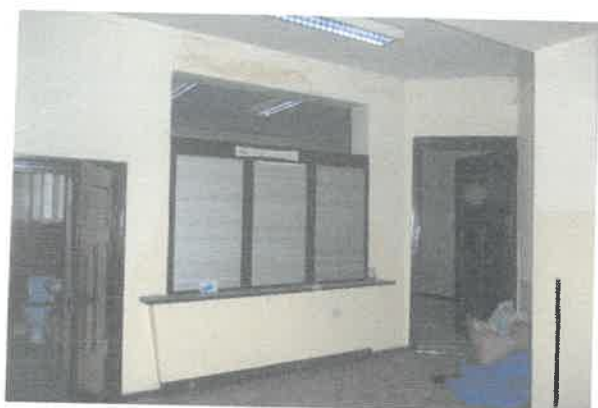
Widok na pomieszczenie nr 1 i w.c.