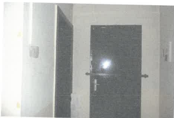
Widok na pom. nr 1 z wyjściem na klatkę schodową