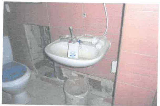
Widok na pomieszczenie w.c.