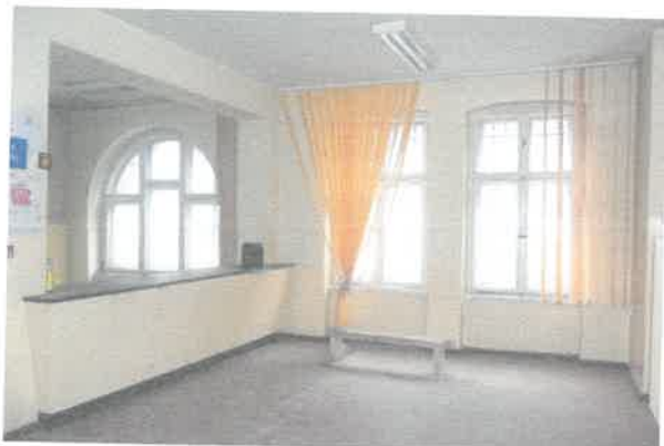
Widok na pomieszczenie nr 1

Lokal użytkowy położony przy ulicy marsz. Józefa Piłsudskiego 57 w Wałbrzychu.