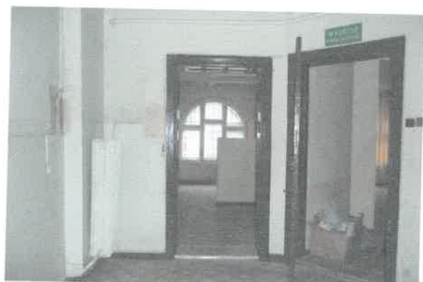
Widok na pomieszczenie nr 2