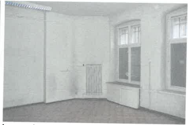
Widok na pomieszczenie nr 2