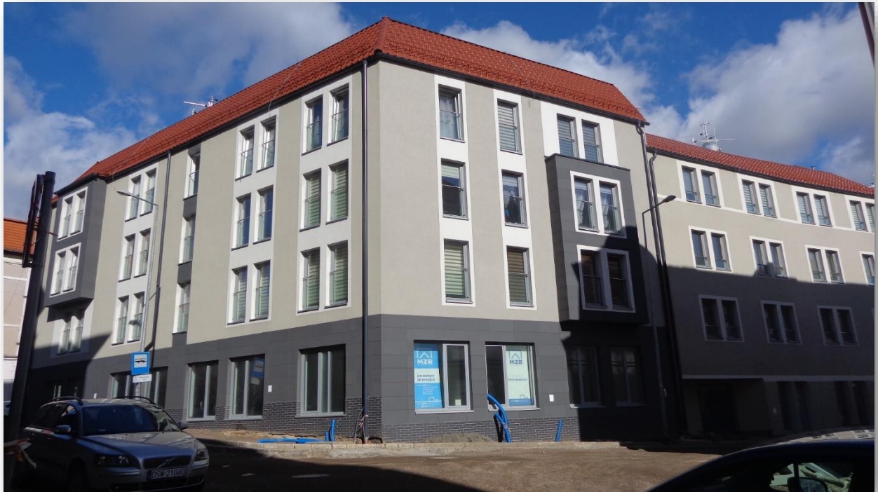
- budynek mieszkalny przy ul. Szczecińskiej 1a po przeprowadzonym remoncie i modernizacji budynku