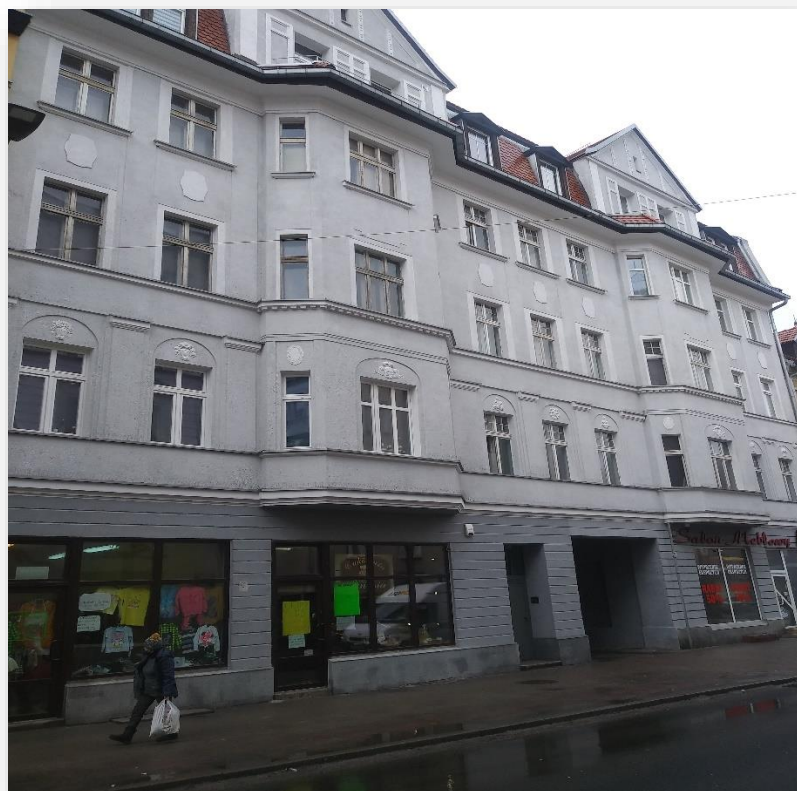
Zdjęcie 1. Al. Wyzwolenia 55