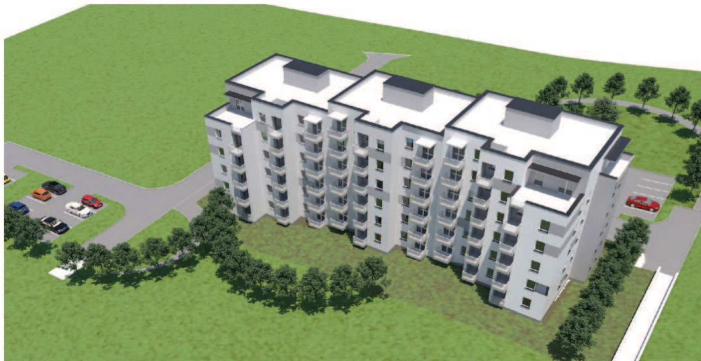
WIZUALIZACJE ELEWACJI ZACHODNIEJ