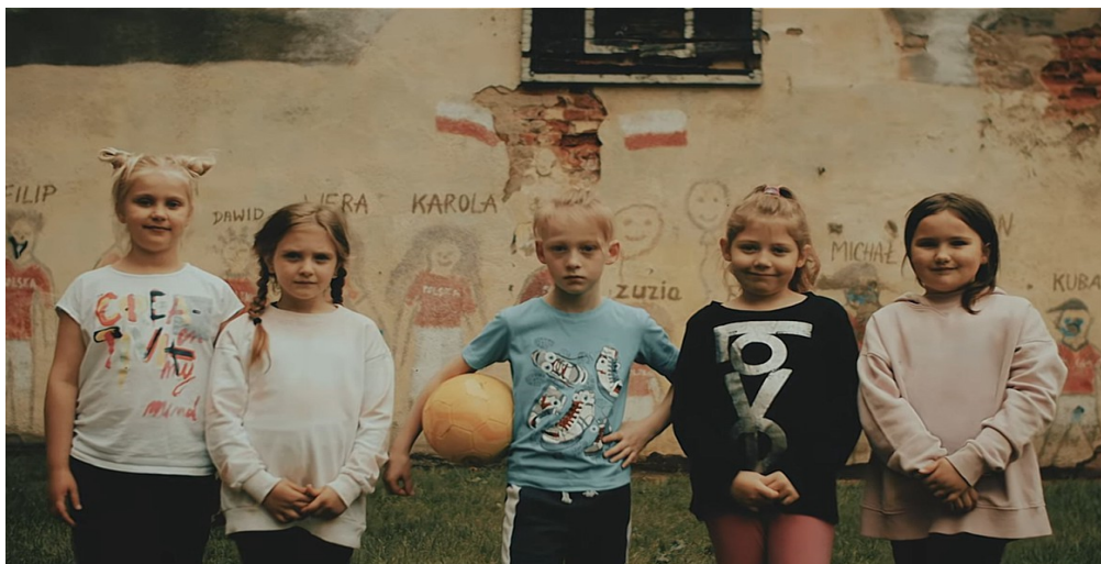
[Kadr z filmu „Wałbrzych. Miasto do odkrycia” w serwisie youtube]