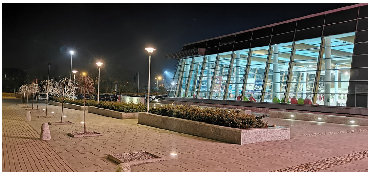
[Aqua-Zdrój, park wodny]

Stara Kopalnia to jeden z najcenniejszych zabytków kultury technicznej na świecie. Po rewitalizacji w 2014 roku najpiękniejszy naziemny kompleks wydobywczy w Polsce i kulturalne serce Wałbrzycha z bogatą ofertą wystawienniczą. To także siedziba Wałbrzyskiego Ośrodka Kultury , organizatora wielkich imprez plenerowych oraz zajęć artystycznych dla dzieci i młodzieży, w tym cieszącego się wieloletnią renomą Zespołu Pieśni i Tańca Wałbrzych .