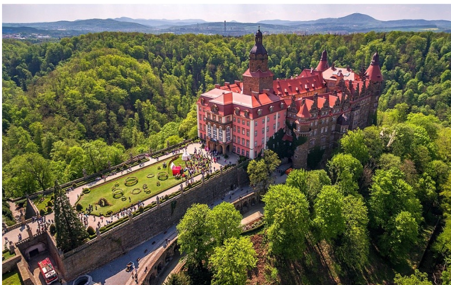
[Książ z lotu ptaka]

Zamek Książ należy do najpiękniej położonych w Europie, trzeci pod względem wielkości w Polsce i największy na Dolnym Śląsku. Rozmiary zamkowej ekspozycji zostały w ostatnich latach mocno rozbudowane, w sąsiedztwie można zobaczyć zagadkową podziemną trasę turystyczną i mauzoleum Hochbergów.