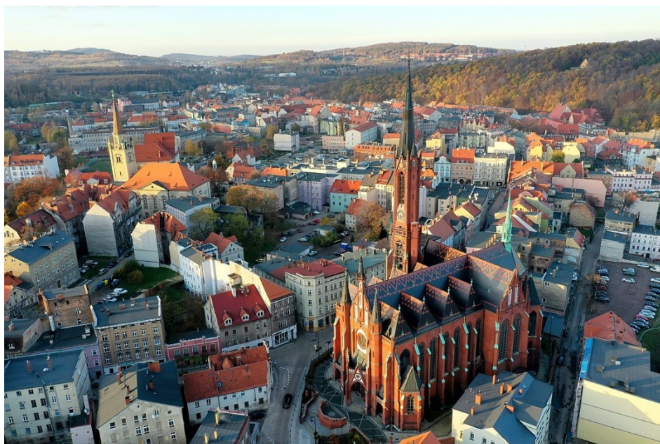
[Stare Miasto z lotu ptaka]

Stare Miasto odnowione ulice, place i zaułki to centrum administracyjne i finansowe Wałbrzycha oraz wspaniałe kościoły, pałace i siedziby renomowanych instytucji kultury. Najstarszy na Dolnym Śląsku Teatr Lalki i Aktora to jedna z najlepszych tego typu scen w Polsce. Teatr Dramatyczny , którego premiery cieszą się ogólnokrajowym rozgłosem. Międzynarodowe uznanie Filharmonii Sudeckiej to zasługa maestrii wykonawczej i tradycyjnej współpracy z wybitnymi, światowej klasy solistami. Miłośników sztuki z pewnością zatrzymają sale wystawienniczej Wałbrzyskiej Galerii Sztuki BWA , której druga siedziba znajduje się w zamku Książ.