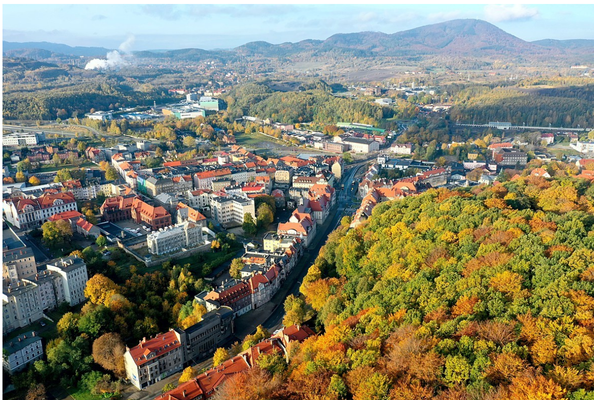
[Po lewej Stare Miasto, po prawej Park Sobieskiego, w oddali wierzchołek Chełmca]

Wałbrzych to 50 kilometrów malowniczych szlaków turystycznych. 170 kilometrów tras rowerowych dla miłośników rekreacji i kolarzy górskich ścigających się na zawodach rangi europejskiej.