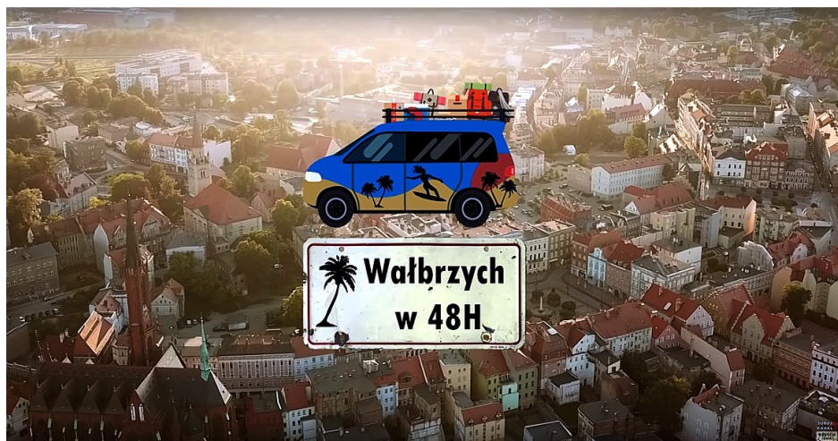
[„Wałbrzych w 48h” - kadr z filmu na kanale Podróże Busem Przez Świat w serwisie youtube]

Umowa z parą popularnych podróżników i blogerów zaowocowała współpracą w organizacji konkursu nt. atrakcji turystycznych Wałbrzycha oraz bogatym materiałem zdjęciowym i filmowym. Następstwem tego były popularne publikacje dotyczące atutów turystycznych miasta na łamach bloga i książki oraz na facebooku, Instagramie i w serwisie youtube.