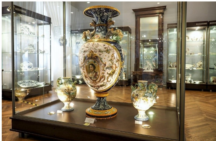
[Muzeum Porcelany]

Muzeum Porcelany założone w 2015 roku w nobliwych murach pałacu Albertich, to jedyne takie muzeum w Polsce. W samym centrum miasta można zobaczyć 10 000 eksponatów. To jedna z najbogatszych kolekcji historycznej porcelany śląskiej.