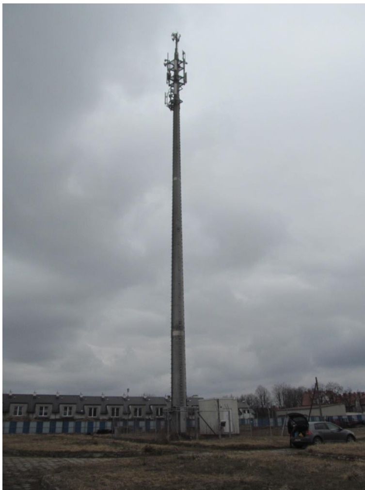
Zał. nr 1: Widok ogólny instalacji radiokomunikacyjnej.

Koniec sprawozdania. Sprawozdanie zawiera dodatkowo załączniki nr 1 i 2.