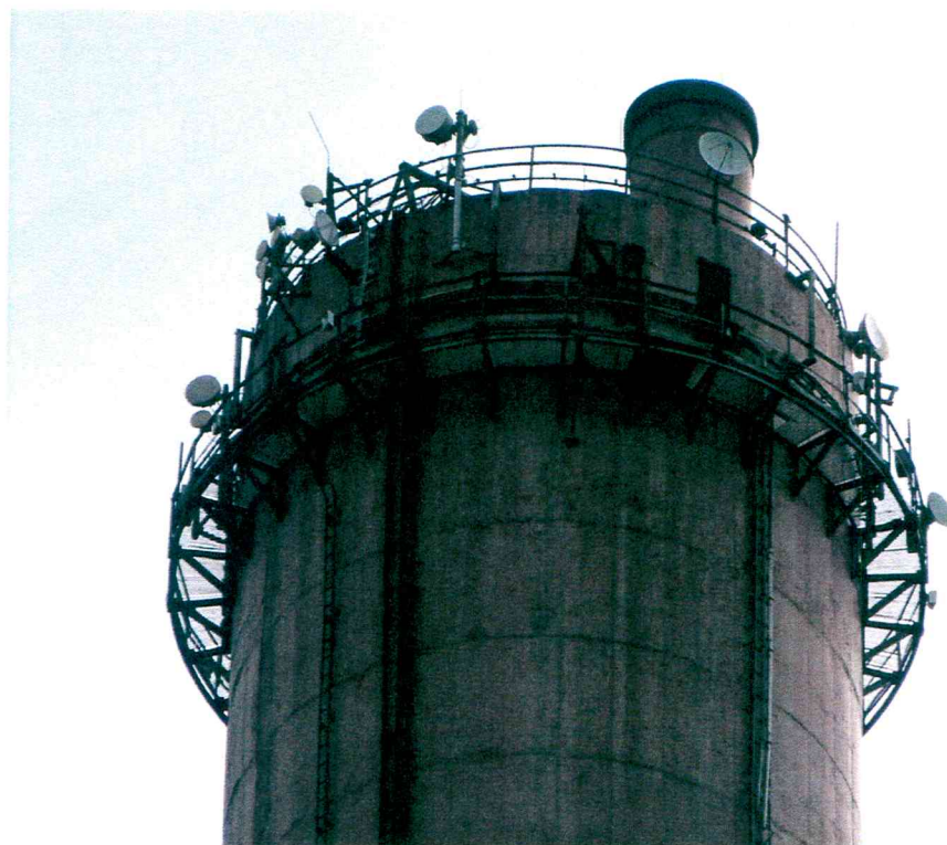
Widok instalacji radiokomunikacyjnej Stacja Netia WALBD047 - WALBM00011 Wałbrzych, ul. Ogrodowa 25.