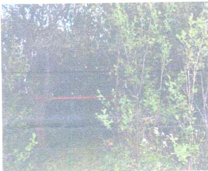
Działka nr 2551

W Miejscowym Planie Zagospodarowania Przestrzennego miasta Ustka pn. „Kwiatowa i okolice” zatwierdzonym uchwałą Rady Miejskiej w Ustce Nr VI/32/2001 z dnia 28.06.2001 roku opublikowanym (Dz. Urz. Nr 72 poz. 875 z dnia 10. 09. 2001 roku) nieruchomości oznaczone geodezyjnie jako działki o numerach 2551, 2552, 2553 , znajdują się na obszarze oznaczonym symbolem: A20MN, dla którego zapis jest następujący: teren zabudowy jednorodzinnej z istniejącym podziałem na działki budowlane w większości zabudowany. Wolne działki do zabudowy zgodnie z ustaleniami rozdziału III i rysunku planu.