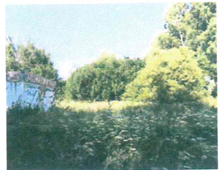
Działka nr 2553