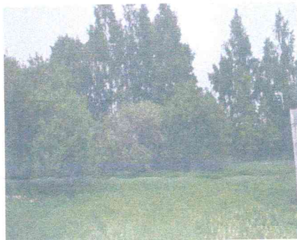
Działka nr 2552