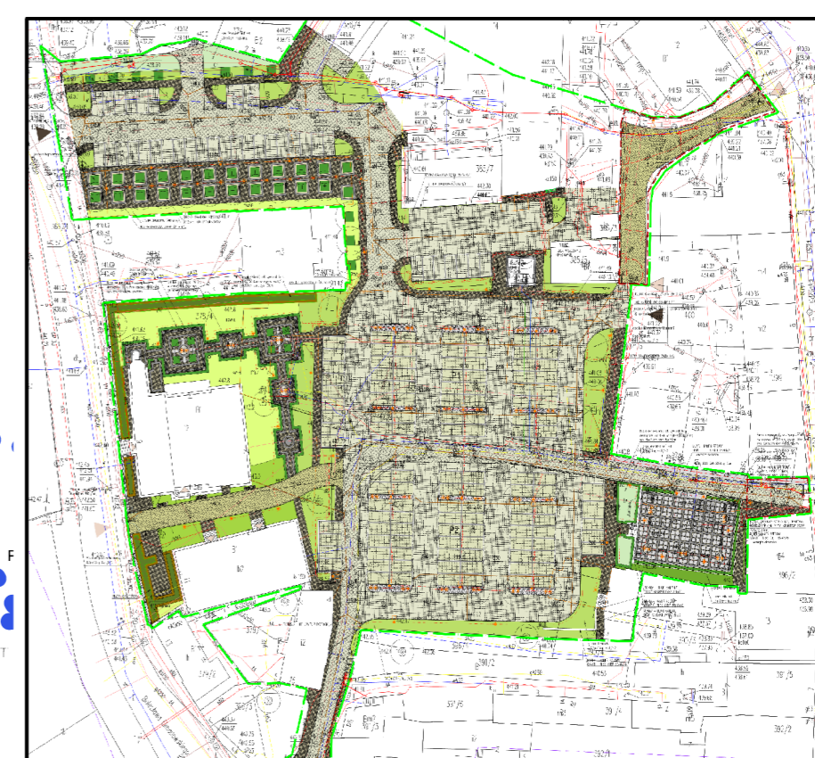
PARKING PRZY UL. RYCERSKIEJ - PROJ. ZAGOSPODAROWANIE